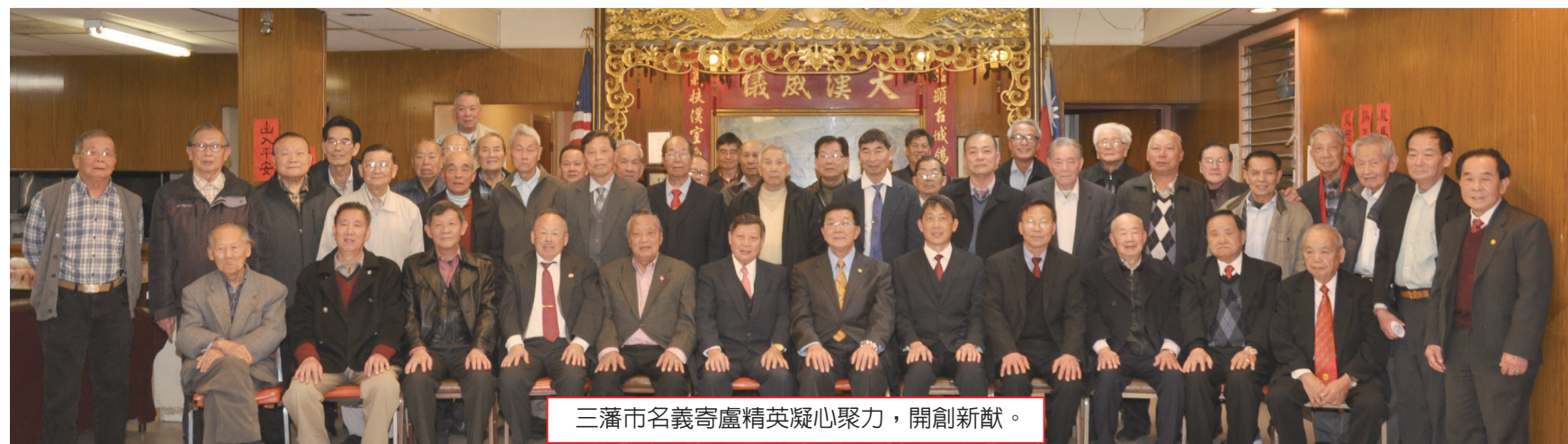
三藩市名義寄盧精英凝心聚力，開創新猷。